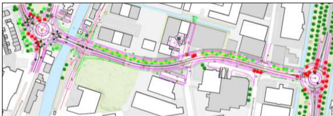
Figuur 2: Wegontwerp Rembrandttracé (bron: akoestisch onderzoek)