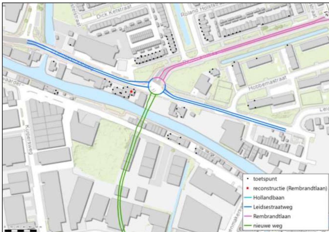
Figuur 6: Woningen waar sprake is van reconstructie vanwege Rembrandtlaan (bron: akoestisch onderzoek)