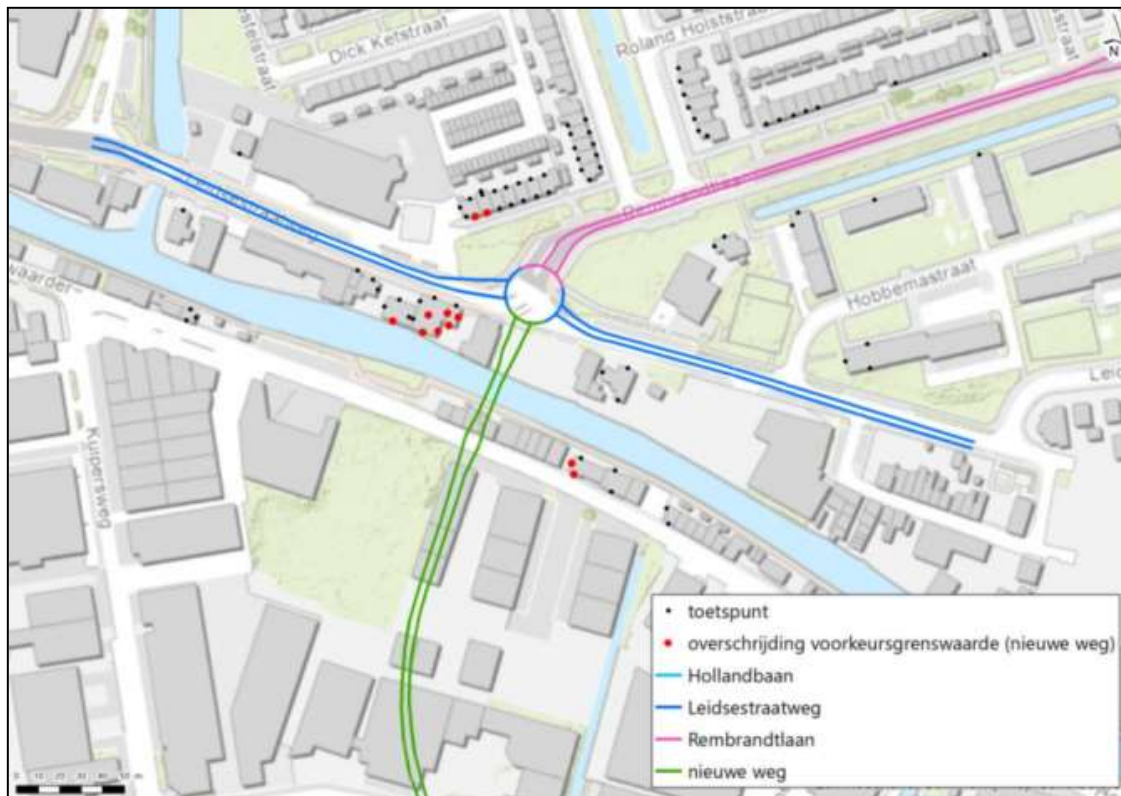
Figuur 3: Woningen met overschrijding vanwege nieuwe Rembrandttracé, noordzijde