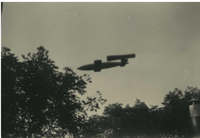
Figuur 2 V1 boven Woerden (NIOD, beeldnummer 162909)

Er zijn geen meldingen van inslagen van V1 en V2 raketten bekend rond de projectlocatie. De locatie ligt niet op de reguliere vliegroutes van V1 en V2 raketten. Toch zijn er boven Woerden waarnemingen van vergeldingswapens bekend. Onderstaande foto (figuur 2) is afkomstig van de beeldenbank van het NIOD. Foto met beeldnummer 162909 toont volgens de beschrijving een overvliegende V1 raket boven Woerden. Er is geen aanleiding om aan te nemen dat op of rond de projectlocatie V1 of V2 raketten zijn ingeslagen.